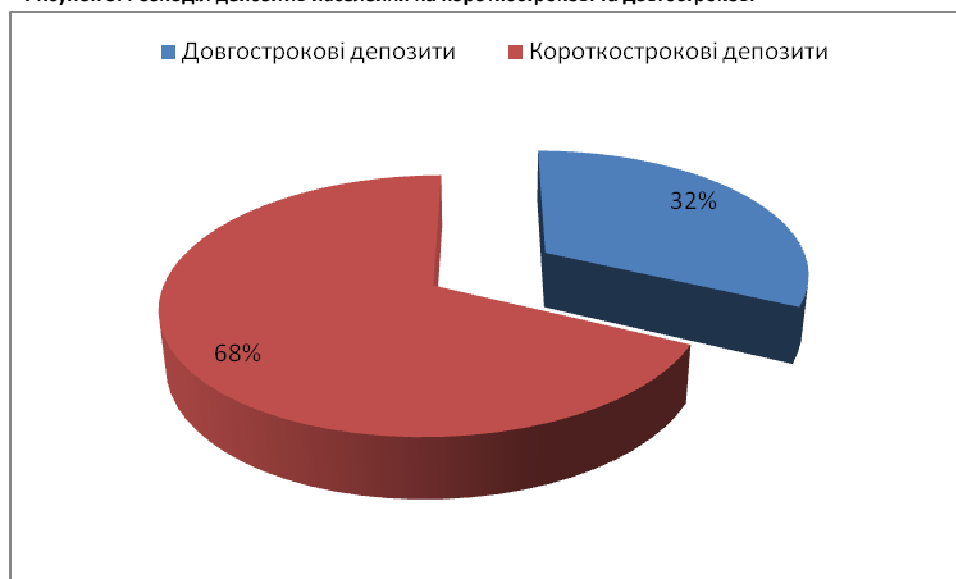
Рисунок 3. Розподіл депозитів населення на короткострокові та довгострокові

Даний матеріал опублікований виключно в інформативних цілях і не є рекомендацією купити чи продати активи, що згадуються в ньому. Судження, оцінки та рекомендації, представлені в даному матеріалі, являються точкою зору авторів. Автори не несуть відповідальність за дії третіх осіб, здійснені чи не здійснені на основі інформації (суджень), викладених в даному матеріалі. Будь які інвестиційні рішення повинні прийматися інвесторами на основі їх власних суджень та аналізу, та на власний ризик. Інформація в матеріалі представлена у тому виді, в якому вона подається на відповідних інформаційних ресурсах. які автори схильні вважати як надійні. Однак, автори не несуть відповідальність за повноту та достовірність поданої інформації у відповідних джерелах. Даний матеріал є інтелектуальною власністю авторів. Будь яке використання, копіювання, розповсюдження даної інформації третіми особами можливе тільки у випадку отримання письмової згоди авторів. Більш детальна інформація може бути отримана після конкретного замовлення.